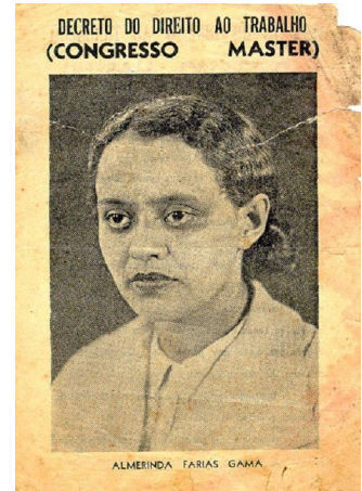
FIGURE 58. Affiche de campagne de Congresso Master, 1934.