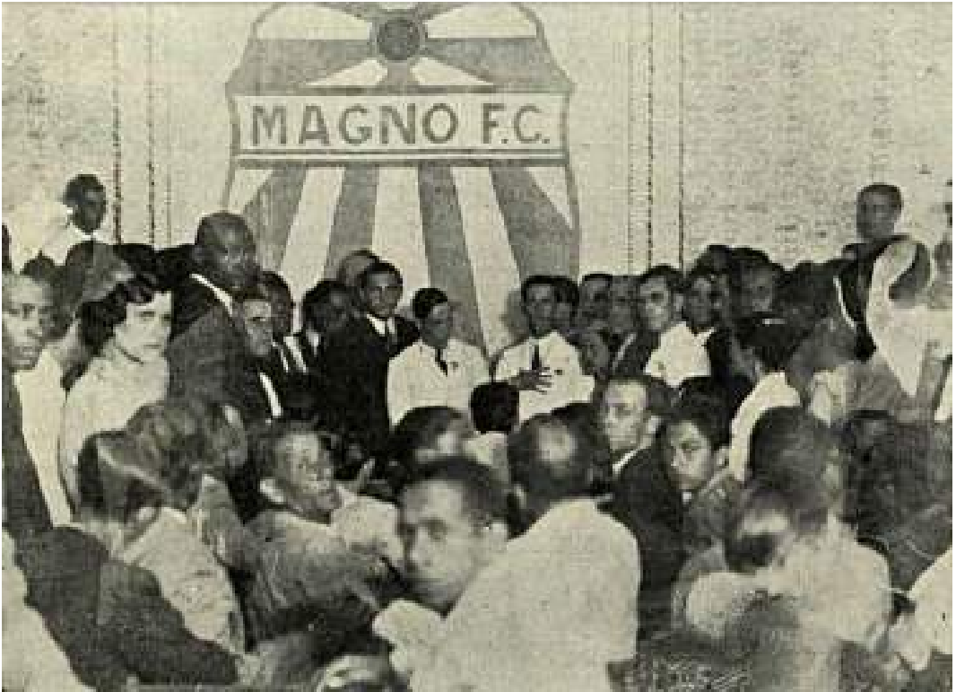
FIGURE 57. L'installation de la succursale de Madureira du Centre civique du 4 novembre.

libres (Alliança dos Eleitores Livres), mais aussi plus remarquablement, la représentante de « Ala Moça » :